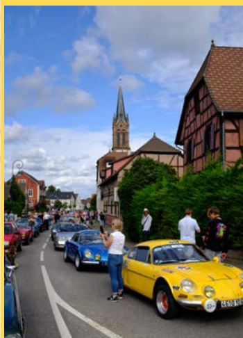
Destination automobile en 2021