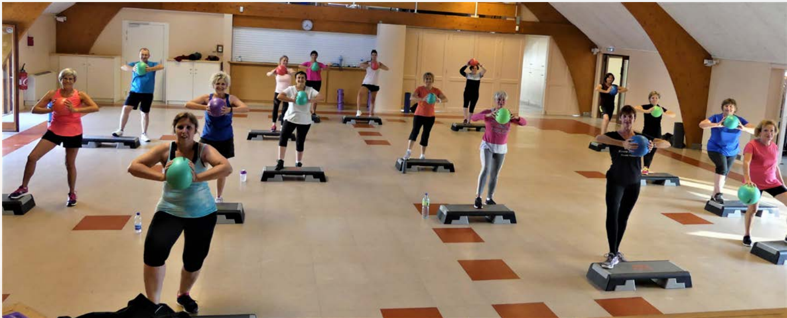
Gymnastique Fitness le jeudi soir

Inscriptions : sur place, auprès des animateurs Carte annuelle membre ASL : 8 euros Renseignements : Raymond GENELOT Tél. : 03 89 81 34 62