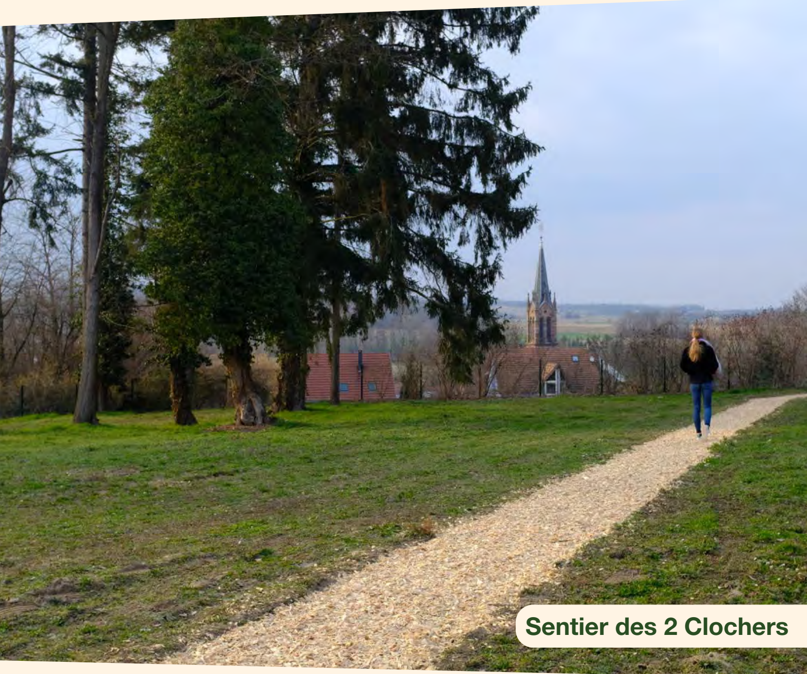
Sentier des 2 Clochers