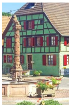
Circuit « Patrimoine » 2,7 km