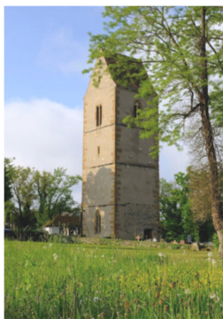
Circuit « Astronomie » 3,0 km

15h30 : Cérémonie de remise des Trophées à la Salle des Fêtes de Dietwiller. Buvette & petite restauration.