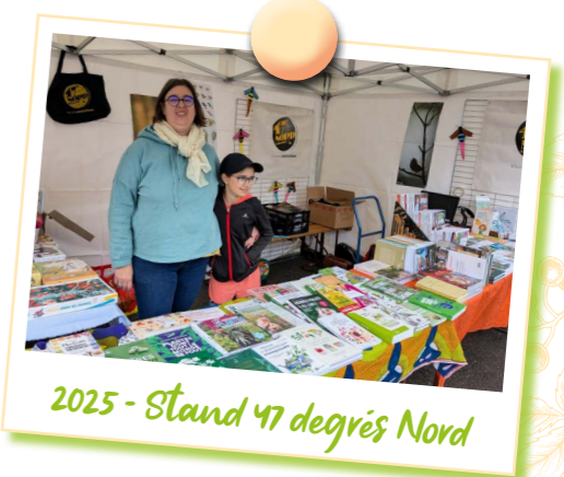
2025 - Stand 47 degrés Nord

REJOIGNEZ-NOUS ! + d'infos : 06 10 39 33 25